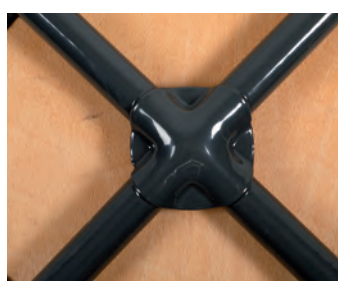
Stahlrosette mit Rohrenden verschweißt