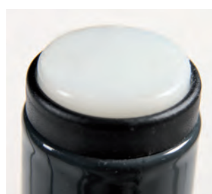
weiße Standflächen verhindern Streifen auf dem Boden