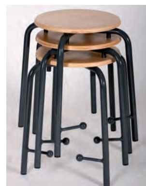
stapelbar trotz Fußrasten